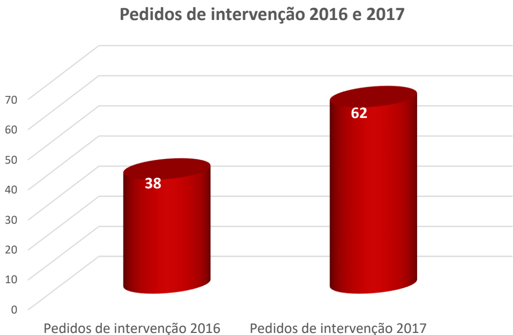
Gráfico 3- Pedidos de intervenção 2016 e 2017

No decurso do ano de 2017 foram registados mais 24 pedidos de intervenção no município de Mora, ou seja, um aumento de 63% relativamente ao ano de 2016.