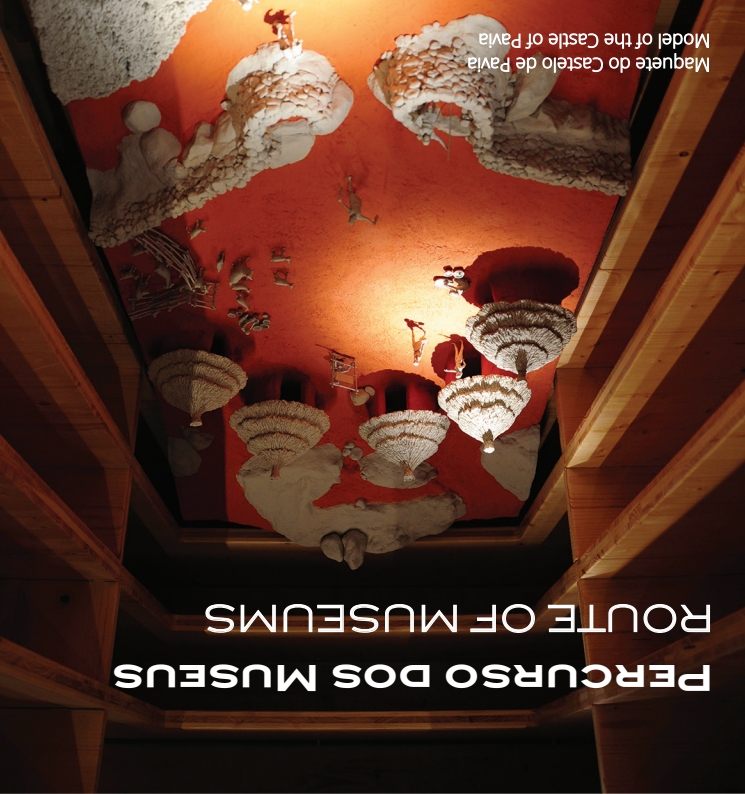
Maquete do Castelo de Pavia Model of the Castle of Pavia