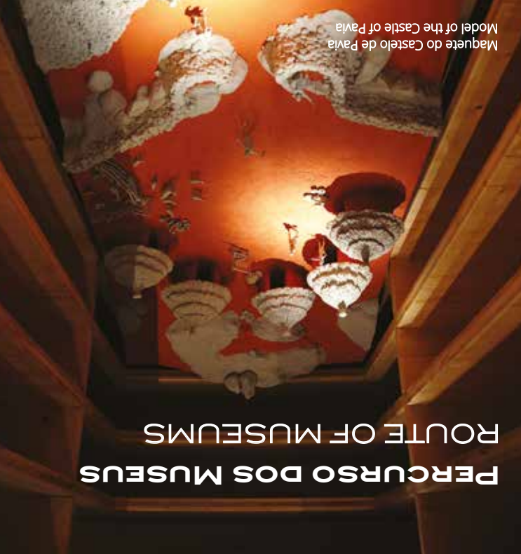
Maquete do Castelo de Pavia Model of the Castle of Pavia