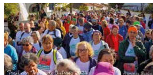
II Trail por Terras de Outrora” - Brotas