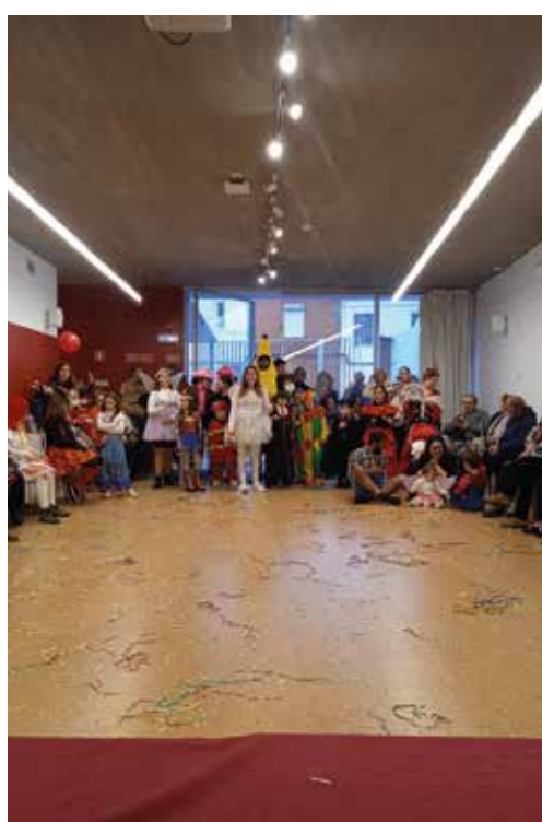
Desfile de Carnaval, Centro Cultural de Cabeção, organização do GRRF de Cabeção.

Há muitos anos que as migas em Cabeção são tradição, e principalmente na altura dos espargos. Além de outros tipos de migas, as migas de espargos com carne do alguidar são as mais procuradas nos nossos Restaurantes.