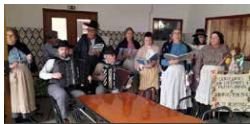
Atuação do Mês das Migas, pelo Grupo de Cantares Alentejanos de Brotas

A Junta de Freguesia estará SEMPRE ao lado do movimento associativo e de todos os que trabalhem em prol de BROTAS.