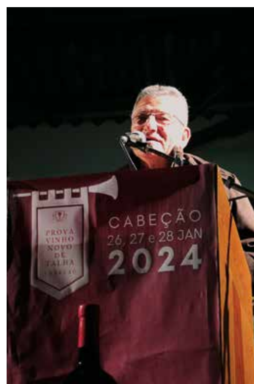
Prova do Vinho Novo de Talha de Cabeção. 26, 27 e 28 jan - CABEÇÃO foi visitado por centenas de Pessoas. Desde 1995 a fazer festa.