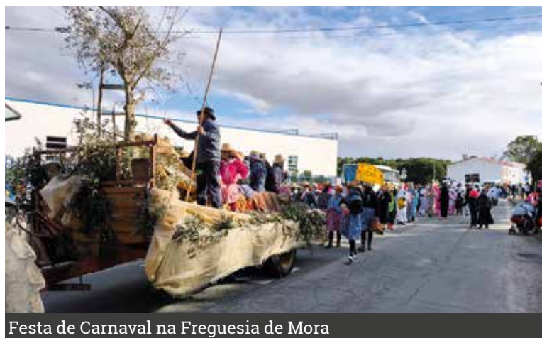
Festa de Carnaval na Freguesia de Mora