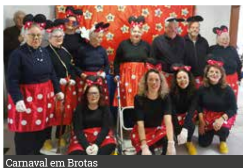
Carnaval em Brotas