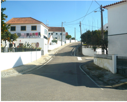
RUA JOSÉ ALVES SALGADO