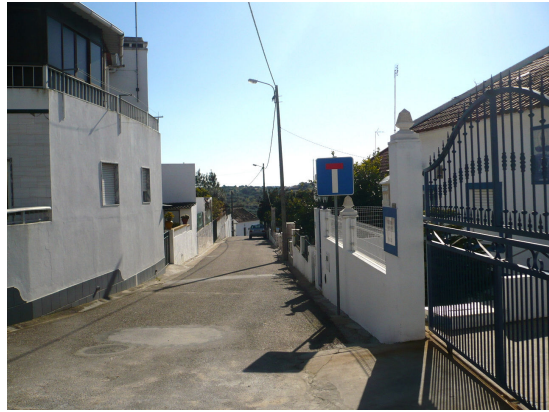
RUA DA ESCOLA