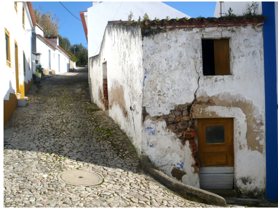
CASA DEGRADADA E DEVOLUTA (rua Joaquim Pereira Cachola)