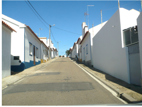
RUA DA DEMOCRACIA