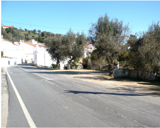
ENTRADA POENTE DE BROTAS