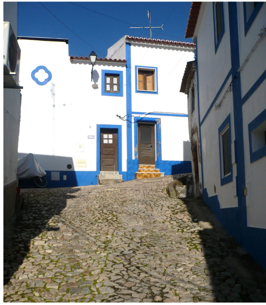
RUA JOAQUIM PEREIRA CACHOLA