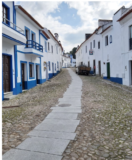
RUA DA IGREJA