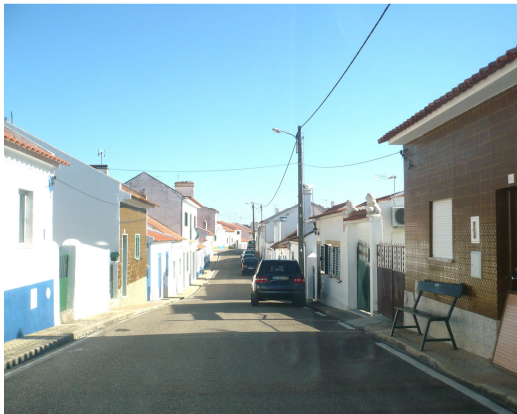
RUA POSSIDÔNIO ALVES SALGADO