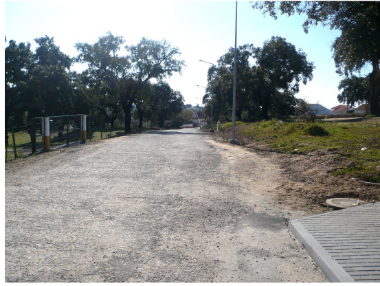
RUA DAS ÁGUIAS