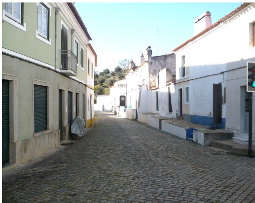
RUA DO MOVIMENTO DAS FORÇAS ARMADAS